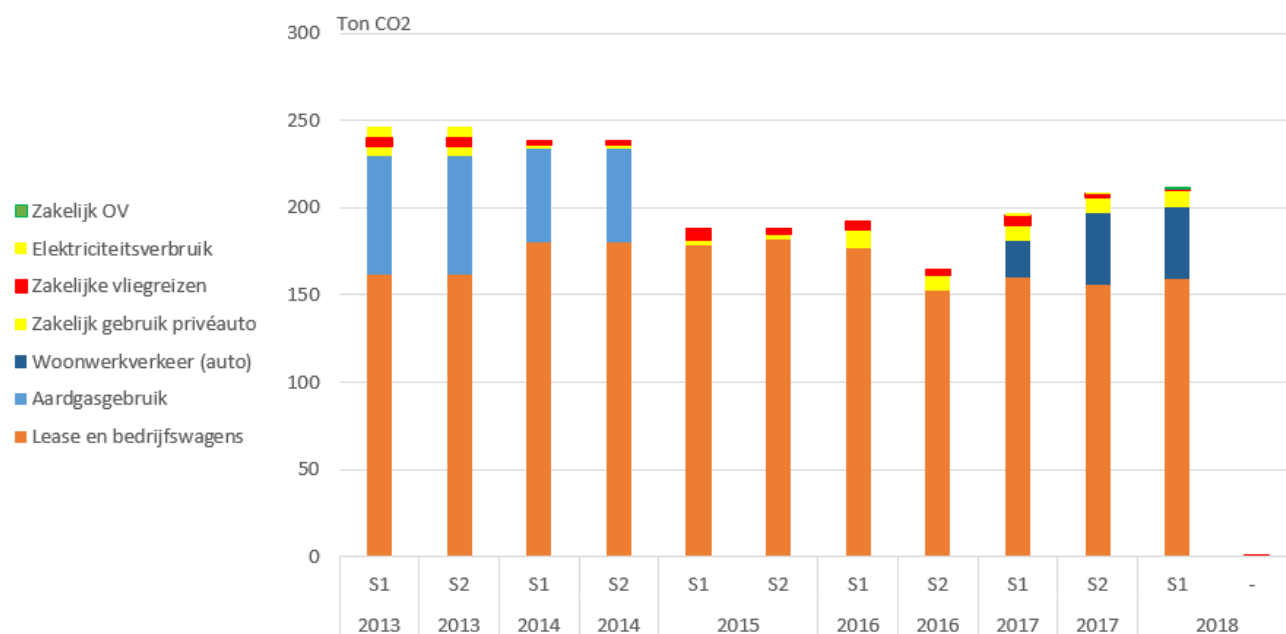
Figuur 1: Voortgang CO 2 emissies Uzin Utz Nederland per half jaar vanaf referentiejaar 2013

In onderstaande figuur is de voortgang van de CO 2 footprint per half jaar te zien. Hierbij is vanaf S1/2017 ook het woon-werkverkeer meegenomen, ondanks dat dit in scope 3 valt (en jaarlijks wordt beoordeeld):